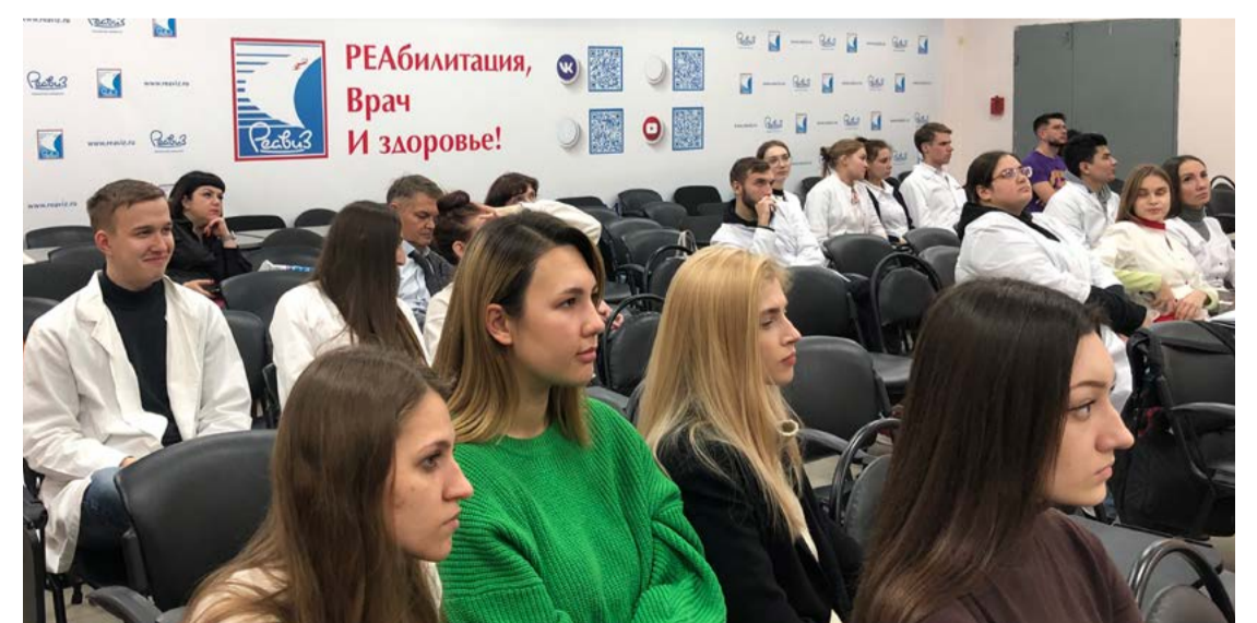
Студенты Медицинского университета «Реавиз» слушают доклады диспута