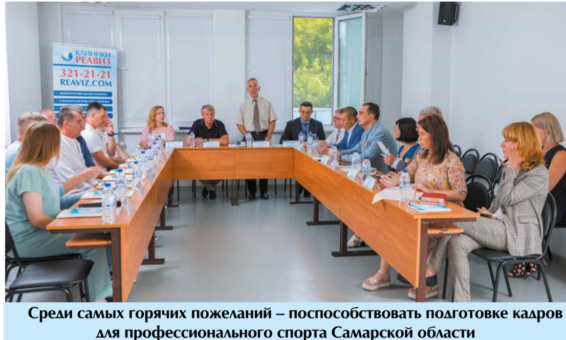
Среди самых горячих пожеланий – поспособствовать подготовке кадров для профессионального спорта Самарской области

Напомним, что МПК «Реавиз» с 2016 года успешно оказывает услуги, востребованные профессиональными спортивными командами Самарской области – медосмотр спортсменов, медицинское сопровождение спортивных мероприятий, медосмотры детских спортивных школ, генетические исследования потенциального физического уровня будущих спортсменов, лечение травм и реабилитация спортсменов, физиотерапия.