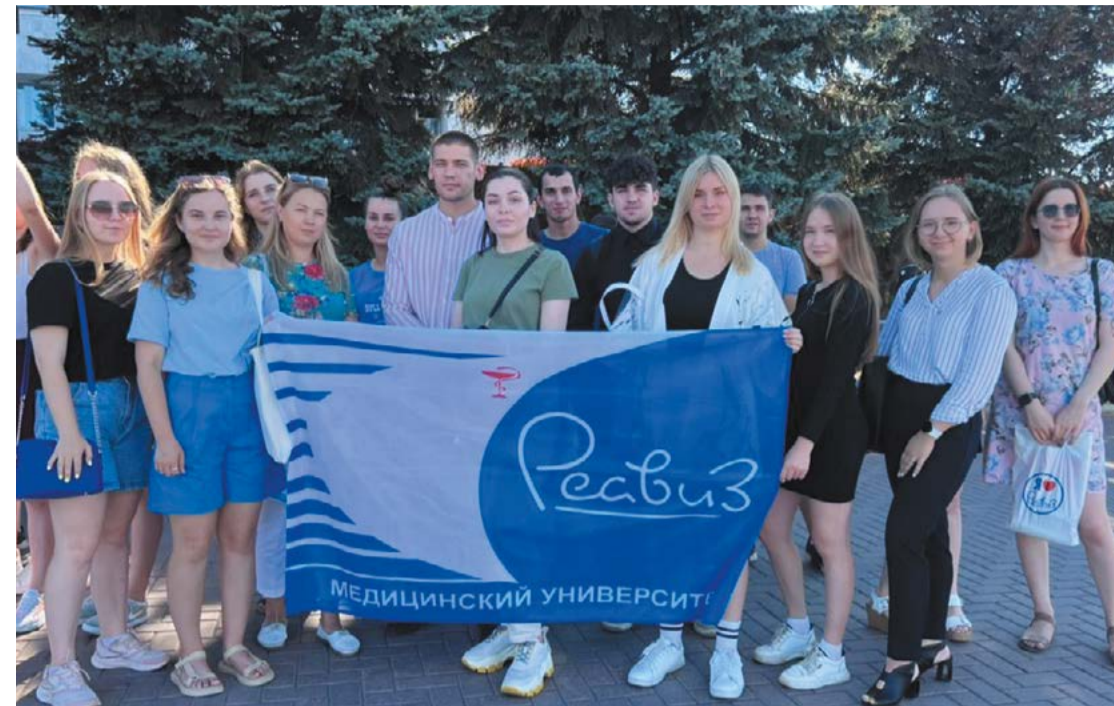
Сотрудники и обучающиеся Медицинского университета «Реавиз» на акциях в поддержку спецоперации на Украине

Сотрудники и обучающиеся Медицинского университета «Реавиз» приняли участие в значимых патриотических акциях