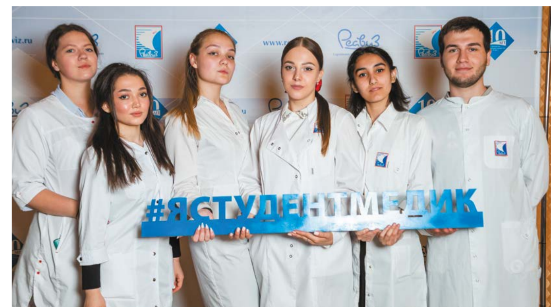
Всегда готовы прийти на помощь!

стенах нашего вуза волонтерами-медиками. Помощь волонтеров, работавших в период пандемии в университетском колл-центре, позволила снизить нагрузку на медицинский персонал и поддерживать качество оказания услуг на достойном уровне. Для нас такое сотрудничество с государственными учреждениями здравоохранения – важный шаг, направленный не только на сбережение здоровья жителей области и возвращение безопасной эпидемиологической обстановки, но и на воспитание достойной смены высокопрофессиональных врачей».